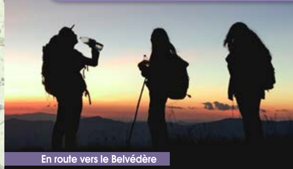
En route vers le Belvédère