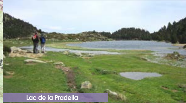
Lac de la Pradella