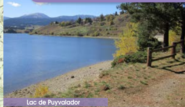
Lac de Puyvalador