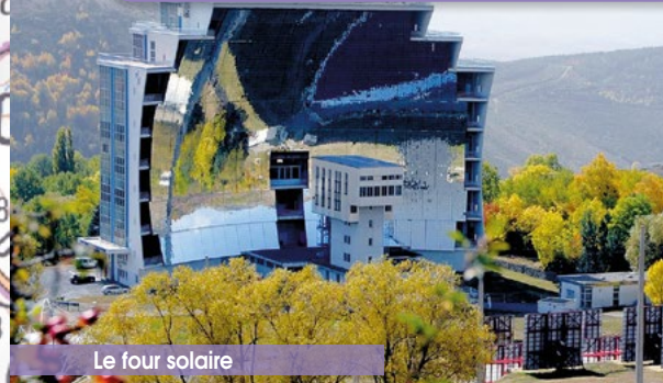
Le four solaire