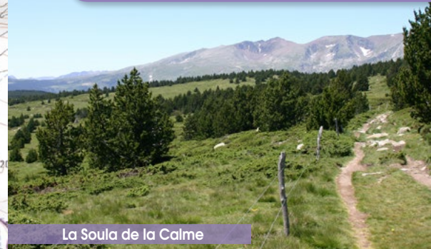
La Soula de la Calme

Devant le refuge prenez la piste de droite qui descend et après 300m, récupérez au point 2 votre itinéraire de montée que vous suivez tout droit pour revenir à votre point de départ.