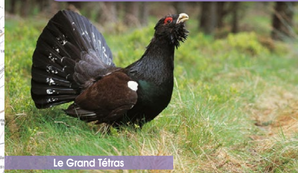
Le Grand Tétrás